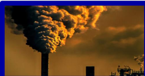
Kontrol og forebyggelse af forurening

Erhvervs- eller beboelses ejendomme med en certificering